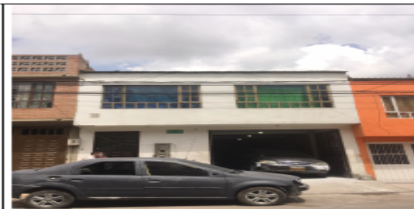
Fotografía No 1. Fachada del Predio.