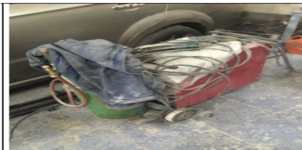
Fotografía No 5. Equipo de soldadura MIG.