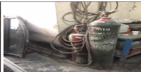
Fotografía No 6. Equipo de soldadura autógena.