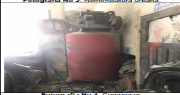
Fotografía No 4. Compresor.