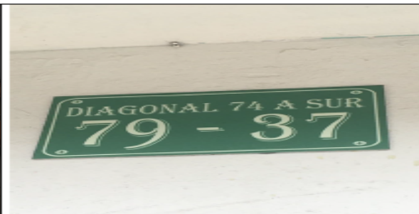
Fotografía No 2. Nomenclatura urbana.